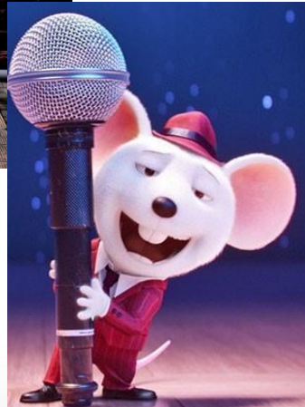
Ростовая кукла «Мышь»